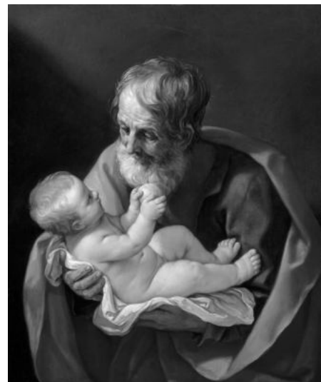
Guido Reni: Szent József és a gyermek Krisztus