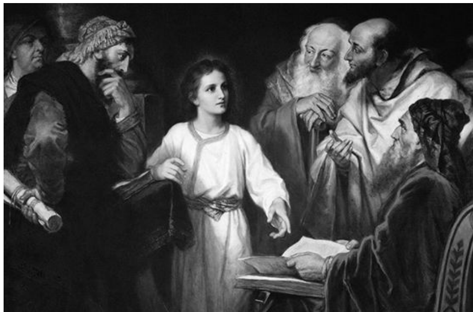
A gyermek Jézus az írástudokkal beszélget a jeruzsálemi templomban.

Jézus héber neve, a Jehoshua vagy Jeshua (héber írásmód szerint):