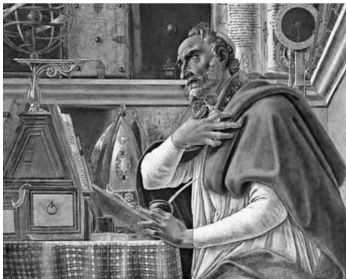
Hippói Szent Ágoston

Ujjongott a Sátán, amikor meghalt Krisztus, mégis ma- gával Krisztus halálával lett