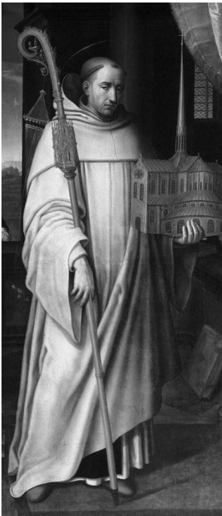
Clairvaux-i Szent Bernát