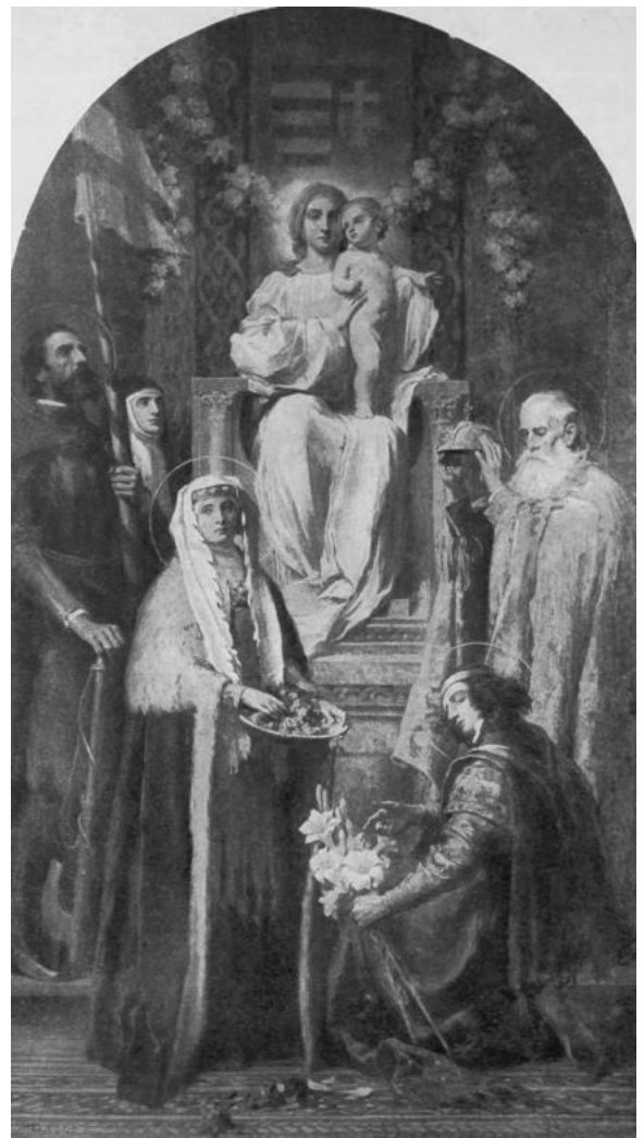
Szűz Mária, a Magyarok Nagyasszonya

1687-ben és 1693-ban I. Lipót király a török uralom alóli felszabadulás alkalmából, 1896-ban Vaszary Kolos hercegprímás - akinek kérésére Róma is elismerte Mária-tiszteletünk nemzeti jellegét -, majd 1998-ban Paskai László bíboros ismételte meg a haza följajánlását.