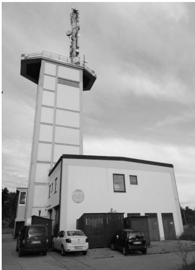
Szent Szeverin Apátság, Kaufbeuren

M. M. - A rend alapításának idején egészen más politikai hatalmak és irányzatok uralkodtak. Ma már egyáltalán