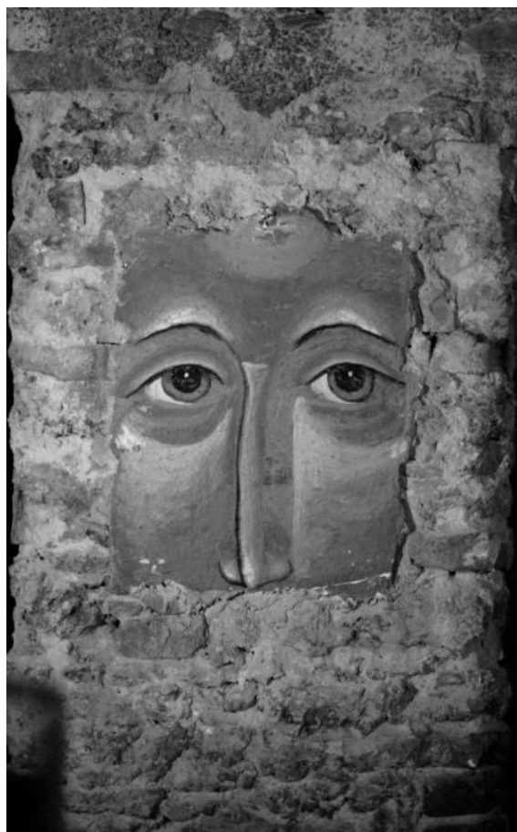
Jézus szeme. Freskórészlet a budapesti, Kiscelli templom altemplomának faláról.

...a hit aktusát ne keverje össze a hit érzetével: teljesen különböznek egymástól. Ha megadja Önnek, legyen hálás, és mondjon köszönetet érte; ha nem adja meg, akkor se csüggedjen!”